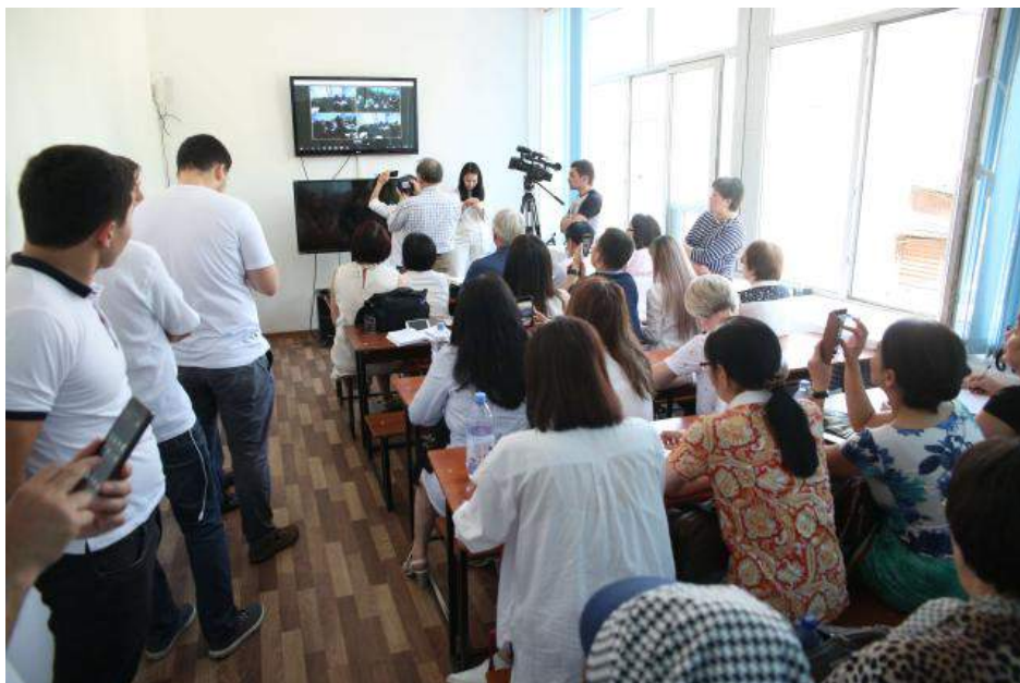
Прямая видеотрансляция из зала суда