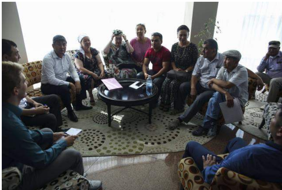
Встреча в Актау

или публичных призывах к захвату власти» (ч. 1, ст. 179 УК). В январе 2019 года уголовное дело против Бисенгазиева закрыли.